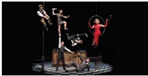
mât chinois acrobatie / aérien manipulateur d'objet