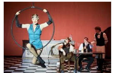
acrobatie / aérien