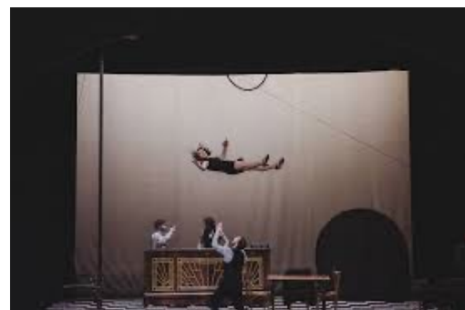
Voltige / aérien