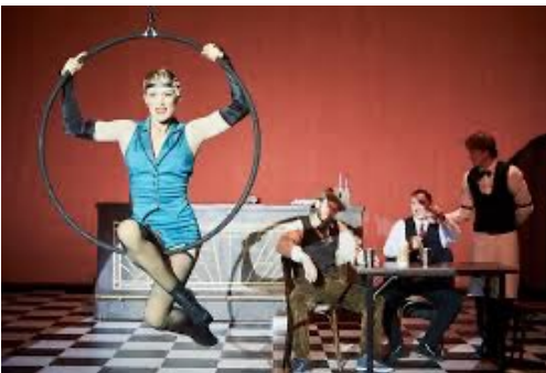
Acrobatie / aérien

d) Voici quelques photographies extraites du spectacle et des disciplines circassiennes : mât chinois, voltige, acrobatie, aérien, manipulateur d'objet. Associez les disciplines de chacun de ces agrès à chaque image correspondante. Plusieurs réponses sont parfois possibles.