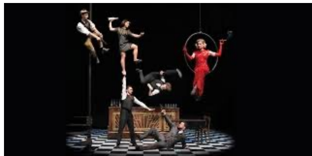
Acrobatie / aérien / manipulateur d'objets