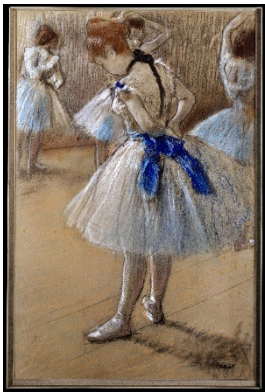
A : Tableau : « Danseuse », Edgar Degas